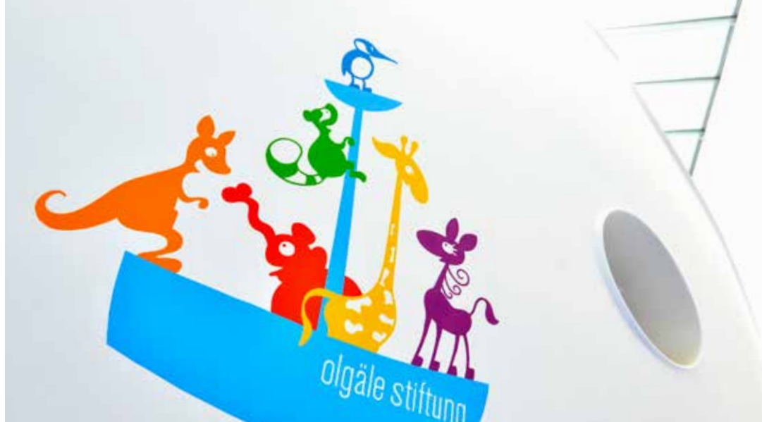
Der Elefant Bruno und seine Freunde bilden ein tierisches Patientenleitsystem