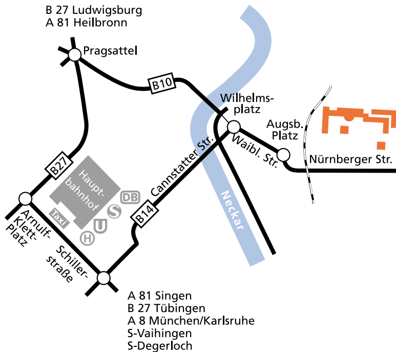
Anfahrtskizze Krankenhaus Bad Cannstatt