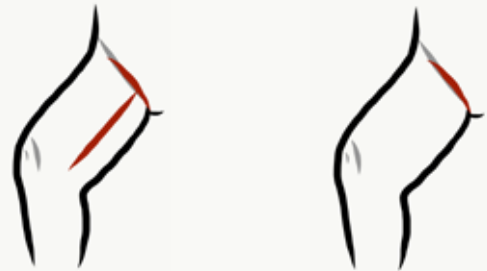
Möglicher Narbenverlauf Oberschenkel