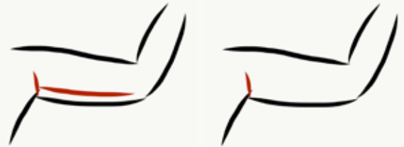
Möglicher Narbenverlauf Oberarme